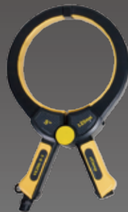
50mm, 100mm, 125mm sizes Sändartänger