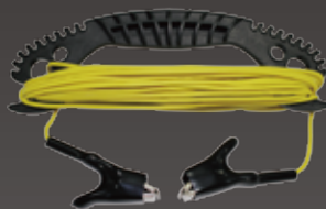
Extension ground cable